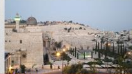
Blick auf den Ölberg

Was zeichnet den „ Anti-Christus “ aus? Woran ist der „ falsche Messias “ zu erkennen?